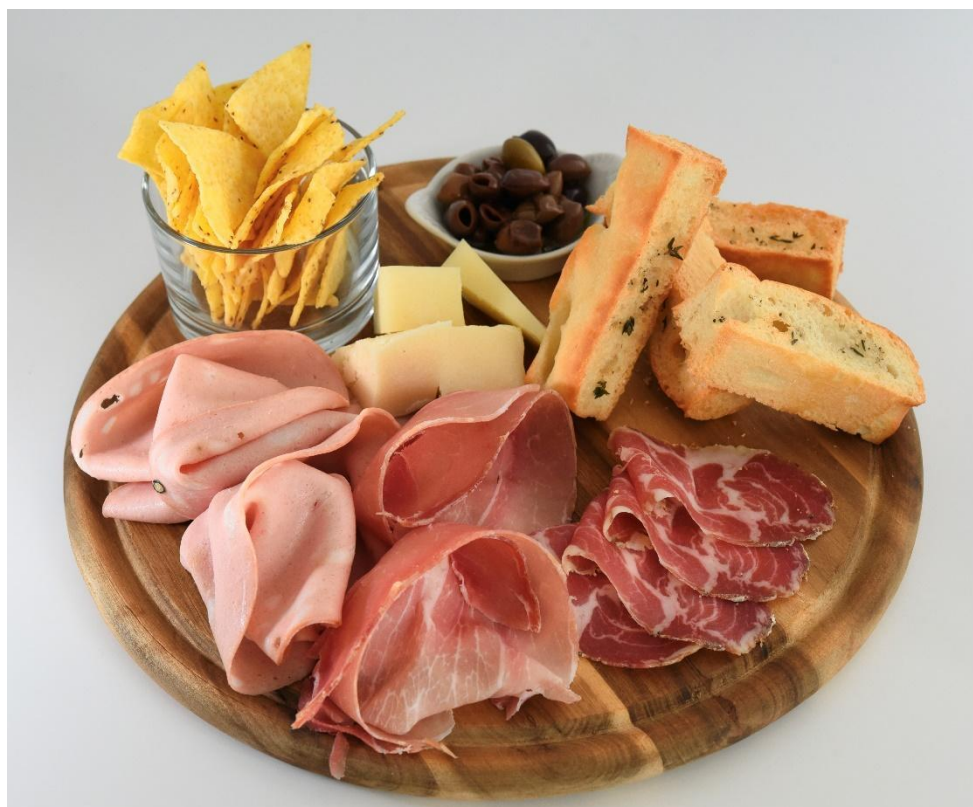
Planche apéritive à partager

A travers le "cabin delivery", Corsica Ferries innove et fait évoluer ses services à bord afin de satisfaire au mieux ses clients. Les passagers pourront savourer un apéritif, une assiette de fruits frais ou tout simplement une boisson en toute tranquillité dans leur cabine et faire une surprise à leurs compagnons de voyage.